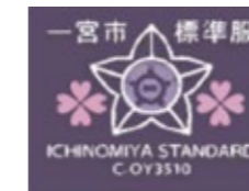
一宮市標準服マーク